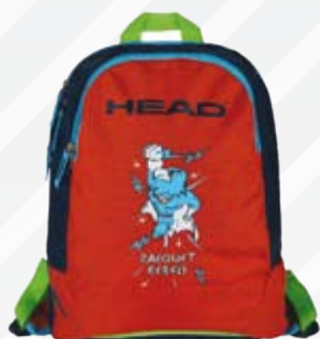
ZAINI HEAD KIDS