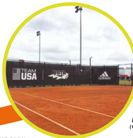
USTA National Campus (ORLANDO-FLORIDA)