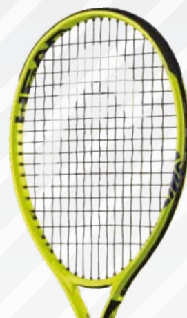
RACCHETTE HEAD 19 - 21 - 23