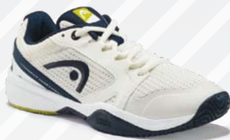
SCARPE HEAD SPRINT JR