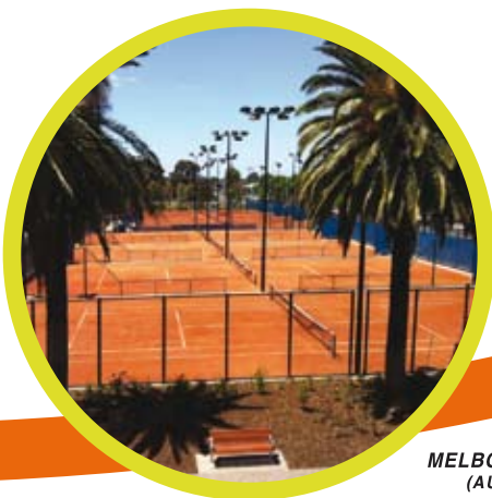
MELBOURNE PARK (AUSTRALIA)