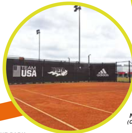
USTA National Campus (ORLANDO-FLORIDA)