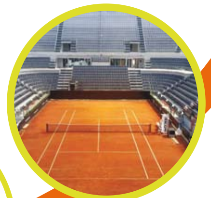
FORO ITALICO (ROMA-ITALY)