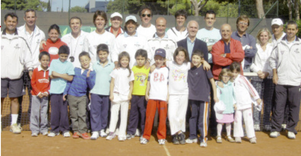
SOPRA, UN GRUPPETTO DEL TEAM “SARANNO CAMPIONI”. SOTTO, ALLIEVI DEI CORSI E DELLA SAT

Ha preso il via per il quarto anno, il progetto “Saranno campioni” portato avanti dal sodalizio, assieme all’assessorato regionale alla Famiglia che sostiene l’iniziativa. Nelle ‘visite’ in sei scuole elementari i maestri del Circolo hanno messo alla prova circa mille alunni invitandone 250 a metà ottobre sui campi di via del Fante per una prova tecnico-attitudinale.