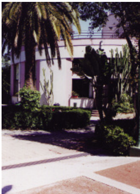
LA PALAZZINA DEL CIRCOLO

“Finalmente il Circolo – aggiunge Cecchinato – si è dotato di una planimetria di tutti i percorsi elettrici sia interrati che non, in modo tale da essere sempre in grado di individuare immediatamente qualsiasi problema. Inoltre seguendo la normativa della leg-