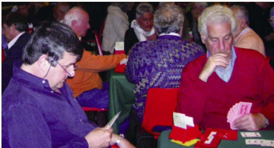
UN MOMENTO DEL TORNEO DI BRIDGE