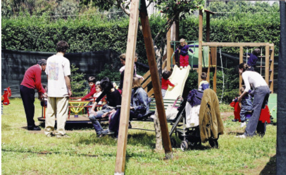
UN'IMMAGINE DEL NUOVO BABY PARK NEL BOSCHETTO GREMITO DI GENITORI E BAMBINI

andava per la maggiore in città a creare l'atmosfera e fare da sfondo musicale (non esistevano i potenti impianti hi fi) e via le coppie più "audaci" ed impertinenti a scatenarsi nei primi timidi approcci con il rock and roll, ma per qualsiasi tutte le altre, "a grande richiesta" musiche lente per i cosiddetti balli da mattonella.