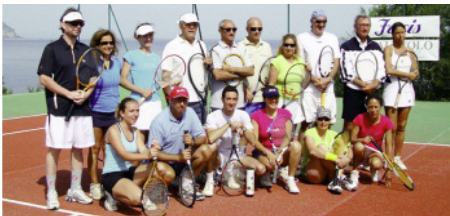
FOTO DI GRUPPO DEI PARTECIPANTI AL TORNEO DI POLLINA