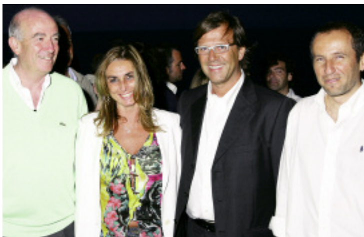
IN ALTO, UNA BELLA IMMAGINE DEL SOLARIUM E DEL GIARDINO CON IL NUOVO PRATO ALL'INGLESE A FIANCO E IN BASSO, SOCI E DIRIGENTI DURANTE IL COCKTAIL DI APERTURA