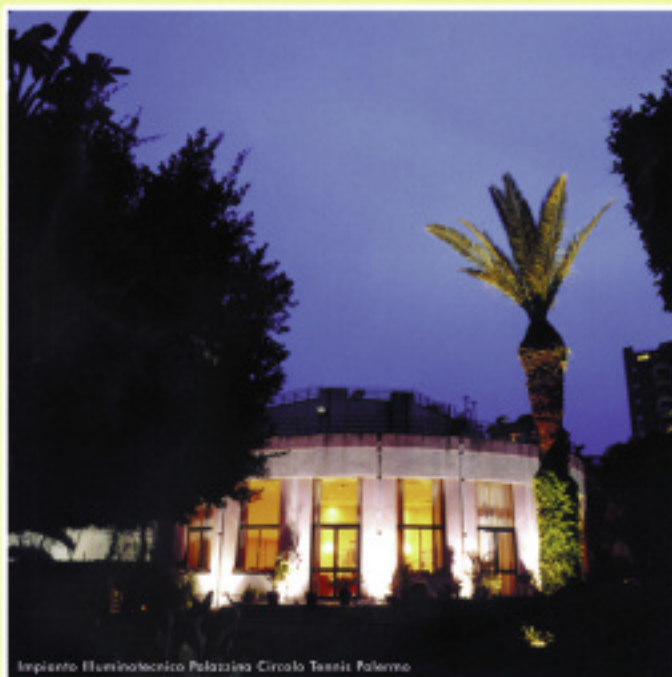
Impianto Illuminotecnico Palazzina Circolo Tennis Palermo

via Giardino Di Carlo, trav. A n°4 - 90030 ALTOFONTE (PA) tel. fax. 091437752 cell. 3395758969