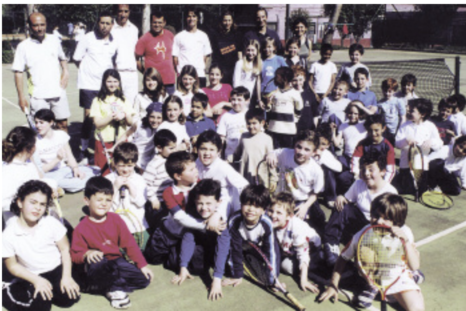
UN GRUPPO DI ALLIEVI ALLA SCUOLA DI ADDESTRAMENTO AL TENNIS

“Con l'illuminazione dei campi destinati ai corsi – spiega il deputato allo Sport, Riccardo Polizzi – potremo allungare le ore di lezione ed ampliare così la base degli iscritti a lista chiusa perché rapportata al numero dei campi e delle ore a disposizione. Fin dal prossimo anno potremo portare le iscrizioni fino ad un massimo di 180 allievi, istituendo un terzo turno di lezioni, a beneficio di quelle famiglie che preferirebbero accompagnare i loro figli a