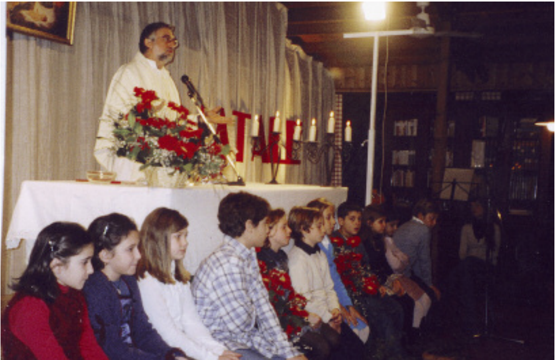
UN'IMMAGINE DELLA MESSA DI NATALE AL CIRCOLO

lungo periodo festivo. Inoltre non mancherà la tradizionale tombola per la Befana. Da scegliere il conduttore.