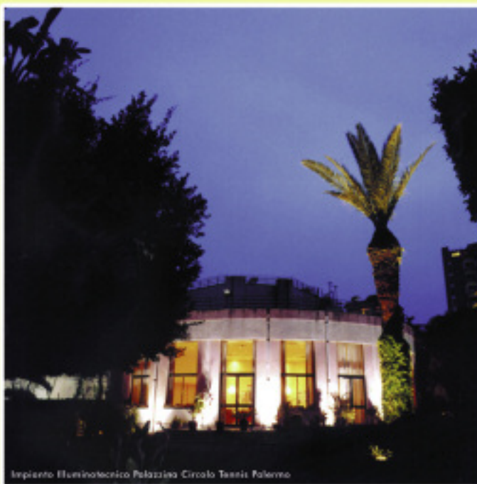
Impianto Illuminotecnico Palazzina Circolo Tennis Palermo

via Giardino Di Carlo, trav. A n°4 - 90030 ALTOFONTE (PA) tel. fax. 091437752 cell. 3395758969