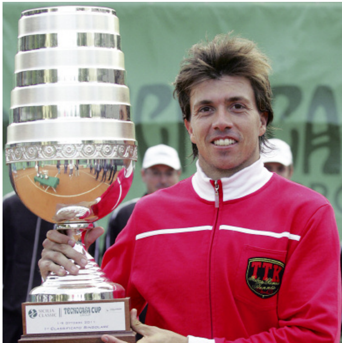
Vittoria assolutamente meritata per l'argentino Carlos Berlocq che non ha concesso un set in tutto il torneo

Come era prevedibile nel tabellone principale c'è stato spazio per i giocatori del Circolo, grazie alle due wild card che il direttore del torneo ha dato ai palermitani Marco Cecchinato e Antonio Comperto, della squadra di serie A1. Purtroppo per loro il sorteggio non è stato benevolo. Cecchinato ha affrontato nel primo turno Berlocq comportandosi comunque molto bene e dimostrando tutto quello che di buono si dice sul suo conto. Comperto, invece, è stato sconfitto sempre al primo turno dal livornese Filippo Volandri. Tre i ragazzi del Circolo che hanno trovato spazio nelle qualificazioni: Claudio Fortuna, sconfitto al secondo turno da Trusendi, Giovanni Valenzafinito ko per mano del siciliano D'Amico al primo turno. Infine, Omar Giacalone ha ceduto anch'egli al primo turno per mano di Trusendi. (G.U.)