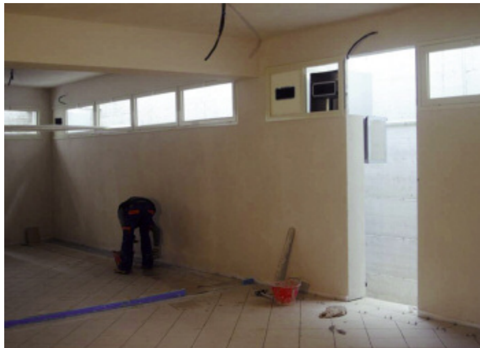
Si stanno ultimando i lavori per i nuovi spogliatoi maschili

Va evidenziato che saranno gli operai del Circolo a realizzare le nuove panche in acciaio e legno. Sono stati acquistati i mate-