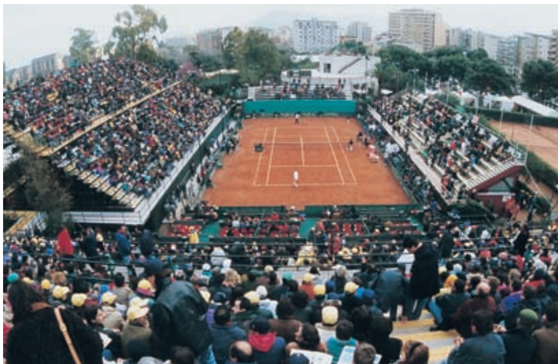
Gli spalti gremiti del campo centrale durante uno degli incontri di Coppa Davis del 1995

"Riportare un torneo internazionale era la nostra principale mission quando ci siamo insediati - ha commentato con gioia il deputato allo sport Giancarlo Savagnone - per questa ragione siamo molto felici. Speriamo di sfruttare al meglio la felice collocazione del challenger nel calendario, in quella settimana, infatti, non ci saranno tornei Atp sulla terra, una circostanza che potrebbe vedere ai nastri di partenza giocatori di alto livello. Tengo a precisare che non ci sarà alcun onere finanziario a carico del nostro club".