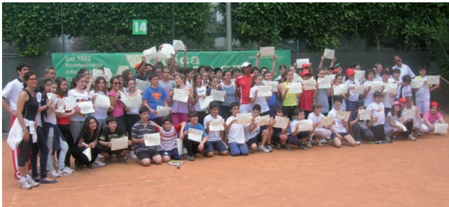
Gli alunni della scuola Marconi, con gli attestati di partecipazione, alla fine della giornata dedicata a “Legalità, fair play e tennis”

“Legalità, fair play e tennis” è l’iniziativa, organizzata dall’Associazione “Fare squadra per vincere” e dal Circolo Tennis Palermo, che si è svolta lo scorso 7 giugno, al Circolo, con il coinvolgimento di un centinaio di studenti di prima, seconda e terza media della scuola “Marconi”. Protagonisti i giovani che per un’intera mattinata sono stati impegnati, prima, due ore in aula con i docenti per parlare di legalità, di fair play e di rispetto delle regole e, poi, due ore in campo con i maestri e gli istruttori per comprendere le basi del tennis. Di solito, gli sport che accompagnano la parte teorica sono il rugby e il basket, questa è la prima volta che le le-