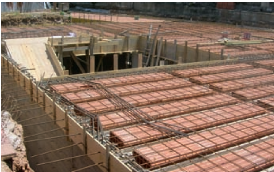
Già realizzato il solaio del nuovo spogliatoio maschile ipogeo

Nel frattempo le opere sono andate, comunque, avanti ed anche in modo spedito. "È stato completato lo scavo - spiega Iano Monaco, responsabile unico del procedimento - sono state realizzate le pareti